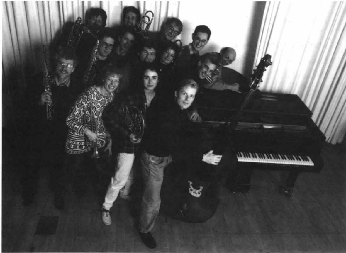
Оркестр «Вольхардинг» (Нидерланды) The orchestra De Volharding (the Netherlands)

Весной 1972 г. Луис Андриессен объединил музыкантов классических оркестров и ансамблей импровизации для исполнения своего нового сочинения. Название композиции — «Вольхардинг» («настойчивость») — и дало имя оркестру. В 70-е годы, когда нормы традиционного сочинительства подвергались сомнению и оспаривались, «Вольхардинг» был в авангарде направления, получившего название Музыка Протеста. Порою политическая активность музыкантов выходила за рамки собственно музыки и принимала формы активного социального протеста, как, например, выступление против войны во Вьетнаме, что иногда даже приводило к инцидентам, подобным аресту музыкантов в Чили в 70-е годы. Музыка Протеста парадоксальным образом объединила черты элитарной стилистики авангарда, джаза и клише массовой культуры. За четверть века своего существования «Вольхардинг» стал одним из ведущих коллективов современной музыки Нидерландов.