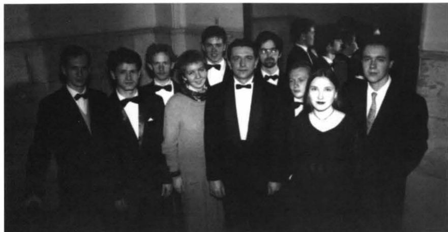
Ансамбль солистов «Студия новой музыки» Ensemble of solists Studio New Music

Ансамбль сформировался в 1993 г. в период подготовки к фестивалю русского искусства во Франции, где состоялись его первые концерты под управлением Мстислава Ростроповича. Тогда же в аспирантуре Московской консерватории был открыт специальный класс современного ансамбля, в котором участники нового коллектива получили возможность совершенствовать свое исполнительское мастерство.