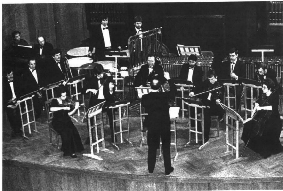
Московский Ансамбль Современной Музыки The Moscow Contemporary Music Ensemble

Ансамбль был создан в марте 1990 г. по инициативе композитора Юрия Каспарова — ныне художественного руководителя коллектива. В его состав вошли лучшие российские музыканты: народный артист России В. Попов (фагот), лауреаты международных конкурсов И. Савинова (виолончель), О. Танцов (кларнет), А. Раев (валторна), А. Лупачик (тромбон) и другие. Репертуар ансамбля огромен и состоит как из произведений современных отечественных и зарубежных композиторов, так и сочинений мировой музыкальной классики. В каждом концерте ансамбля одна или несколько премьер. Особое место в деятельности коллектива занимает продвижение произведений российского авангарда 20—30-х годов. С именем ансамбля связаны первые авторские концерты в России Н. Рославца и А. Мосолова. Коллектив исполнял сочинения Д. Мелких, В. Дешевова, А. Лурье и других авторов того периода. Впервые в России ансамбль выступил с авторскими программами известных мастеров XX века — Э. Вареза, Я. Ксенакиса, Д. Куртага и других, исполнил музыку композиторов Франции, Швейцарии, Германии, Испании, Дании, Италии, Канады. Московский Ансамбль Современной Музыки записал около 30 компакт-дисков для крупных компаний Англии ( Olympia ), Франции ( Le Chant du Monde совместно с Harmonia Mundi ), Японии ( Meldac ). Ансамбль много гастролирует как в России и городах СНГ, так и за рубежом. Он принимал участие в международных фестивалях в Германии, Швейцарии, Дании, Турции, Франции, Испании, Японии, Нидерландах, Словакии, Чехии.