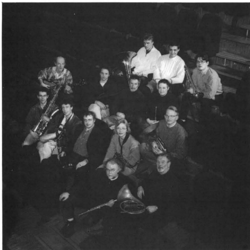
Оркестр «Эрепрайз» (Нидерланды) Orchestra De Ereprijs (the Netherlands)

Оркестр «Эрепрайз» сформировался в начале 80-х годов. Своеобразный состав оркестра (духовые, ударные и электронные инструменты) связан с особой эстетической задачей — стремлением разрушить барьеры между «высокой» и прикладной музыкой, элитарными и популярными жанрами, концертным и уличным музицированием. Некоторые музыканты оркестра имеют опыт игры как в академических симфонических оркестрах, так и в рок-группах.